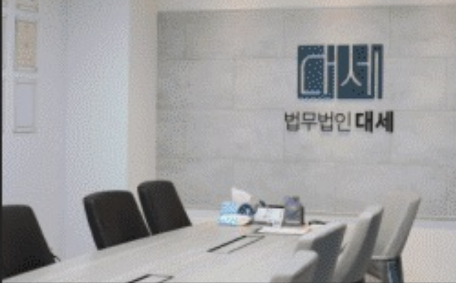
법무법인대세 방문 · 상담