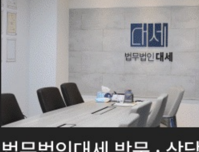
법무법인대세 방문 · 상담