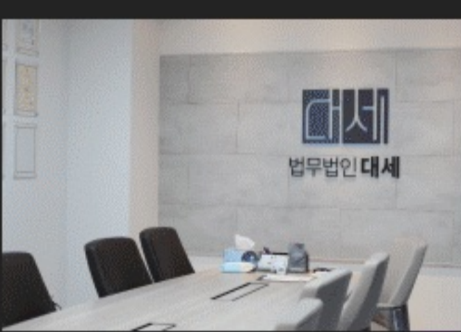
법무법인대세 방문 · 상담