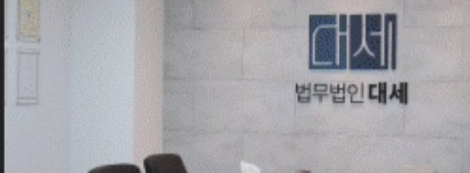
법무법인대세 방문 · 상담